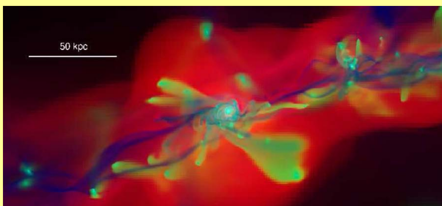
גלקסיה ביקום הצעיר

כיצד נוצרו גלקסיות? כיצד התקררו ענני גז והפכו לכוכבים? מה מווסת את הווצרות הכוכבים? מה הביא ליצירת חורים שחורים מסיביים במרכזי גלקסיות? מה הקשר בין הגלקסיות הנצפות מתקופת היקום הצעיר והגלקסיות של ימינו? מהי הדינמיקה של צבירי כוכבים ופלזמה ליד אופק הארועים של חור שחור?