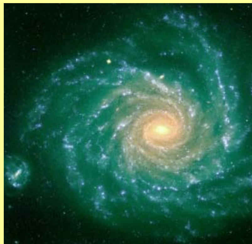
גלקסיה ספירלית כיום