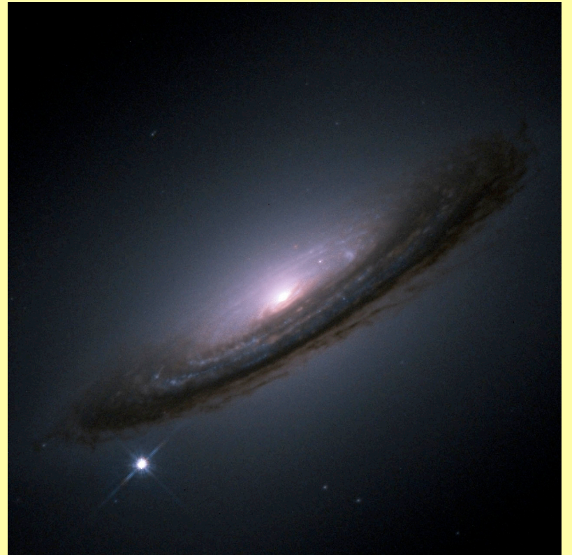
סופרנובה 1994D בגלקסיה NGC 4526