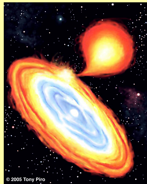
איור של סופרנובה מסוג Ia