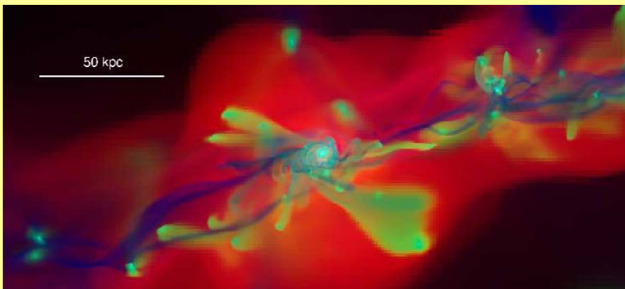
גלקסיה ביקום הצעיר

כיצד נוצרו גלקסיות? כיצד התקררו ענני גז והפכו לכוכבים? מה מווסת את הווצרות הכוכבים? מה הביא ליצירת חורים שחורים מסיביים במרכזי גלקסיות? מה הקשר בין הגלקסיות הנצפות מתקופת היקום הצעיר והגלקסיות של ימינו? מהי הדינמיקה של צבירי כוכבים ופלזמה ליד אופק הארועים של חור שחור?