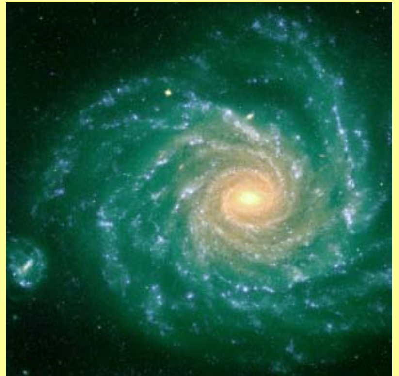
גלקסיה ספירלית כיום